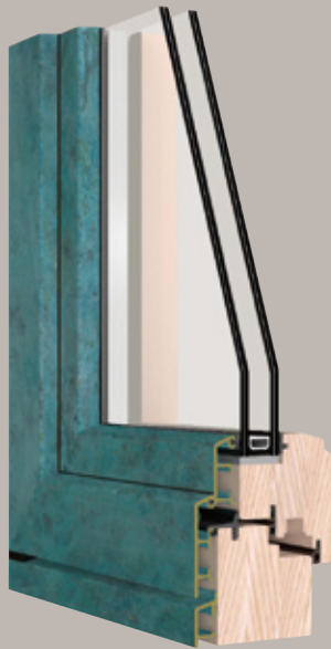
System Bronze Quadra Modernes Design mit rechteckiger Linienführung.

Das System Bronze verwendet eine Sondermessinglegierung, die keinerlei Oberflächenschutz oder Wartung erfordert. Die Patina, die sich auf natürlichem Weg bildet, stellt den besten und dauerhaftesten Schutzschild dar und garantiert eine außergewöhnliche Langlebigkeit des Fensters. Brünierung: Die Brünierung erfolgt nach dem Verschweißen der Rahmen und beschleunigt einen natürlichen Vorgang. Sie bewirkt die Bildung einer Patina, die gleichmäßig oder gealtert wie antike Bronze aussehen kann. Verkupferung: Zur Verkupferung, die nach der Verschweißung der Rahmen erfolgt, wird auf der Profiloberfläche eine spezielle Substanz angebracht, die auf den Kupferanteil der Legierung einwirkt und ihn „altern“ lässt. Zu sehen ist das typische Grün des Grünspans, wie man ihn auch von lange im Freien stehenden Statuen oder den Kupferdächern historischer Gebäude kennt.